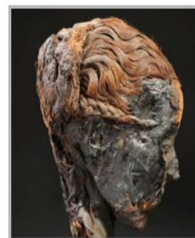
MUSEO DI ANTROPOLOGIA ED ETNOGRAFIA