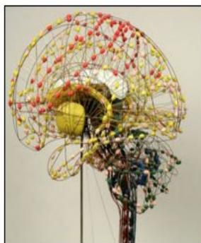
MUSEO DI ANATOMIA UMANA LUIGI ROLANDO