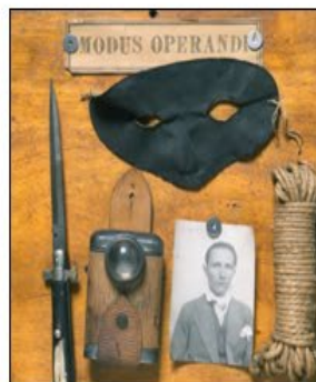
MUSEO DI ANTROPOLOGIA CRIMINALE CESARE LOMBROSO