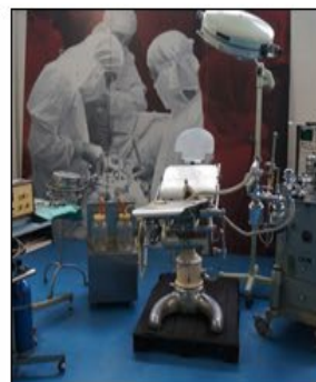
ASTUT Archivio Scientifico e Tecnologico Università di Torino